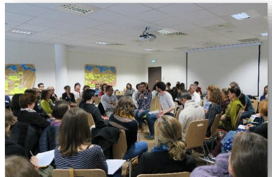
Cercle excentrique réalisé au cours de la journée du 12 mars 2018 sur les QSV organisée par le Pôle ESE ARA

Dépasser l'opposition entre rationalité scientifique et rationalité sociale peut « permettre au collectif de se réapproprier la décision » (Simonneaux 2016). C'est à toutes ces conditions que pourront se développer une prise de position en conscience ainsi que la construction collective de solutions, et la possibilité d'un engagement