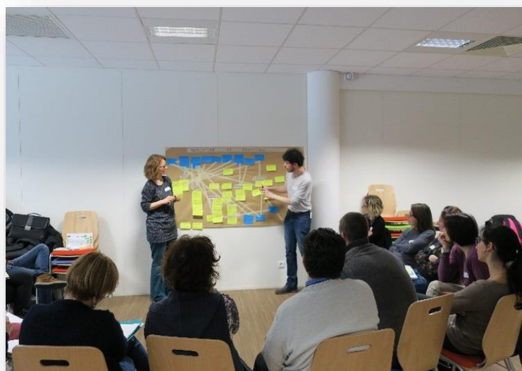
Construction d'une carte de représentation des controverses lors de la journée du 12 mars 2018 sur les QSV organisée par le Pôle ESE ARA

http://www.theatredelopprime.com/compagnie/theatre-forum/