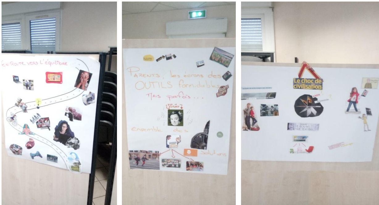
Affiches de prévention permettant de travailler les représentations